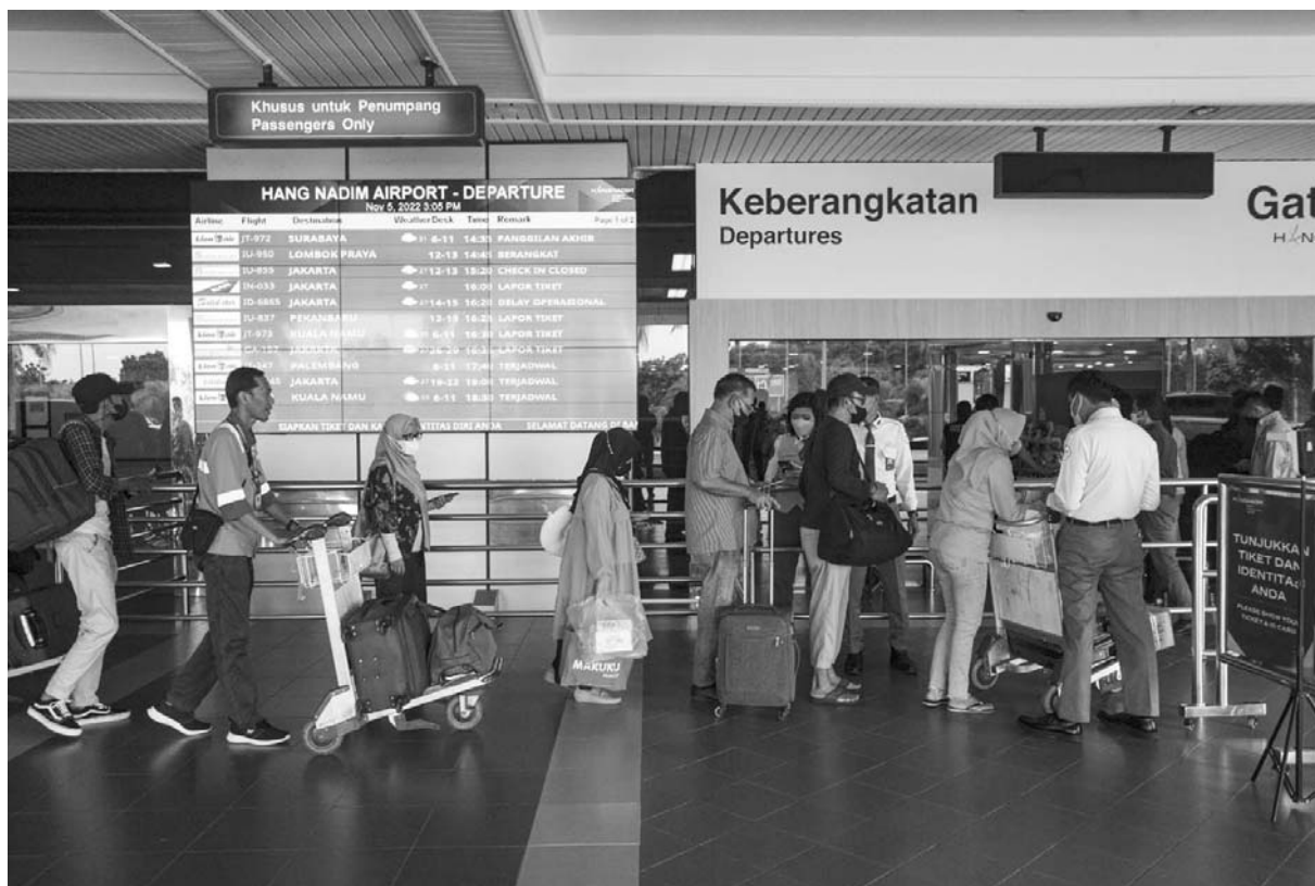
PROYEK PENGEMBANGAN BANDARA INTERNASIONAL HANGNADIM : Sejumlah calon penumpang antri masuk ke dalam terminal keberangkatan di Bandara Internasional Hang Nadim, Batam, Kepulauan Riau, Sabtu (5/11/2022). PT Wijaya Karya (Persero) Tbk (WIKA) resmi ditunjuk sebagai kontraktor pelaksana proyek untuk melakukan pengembangan bandara tersebut, seperti pemugaran terminal 1, pembangunan terminal 2, perluasan apron, serta pengembangan beberapa fasilitas airside dan landside dengan nilai kontrak sebesar Rp2,18 triliun.